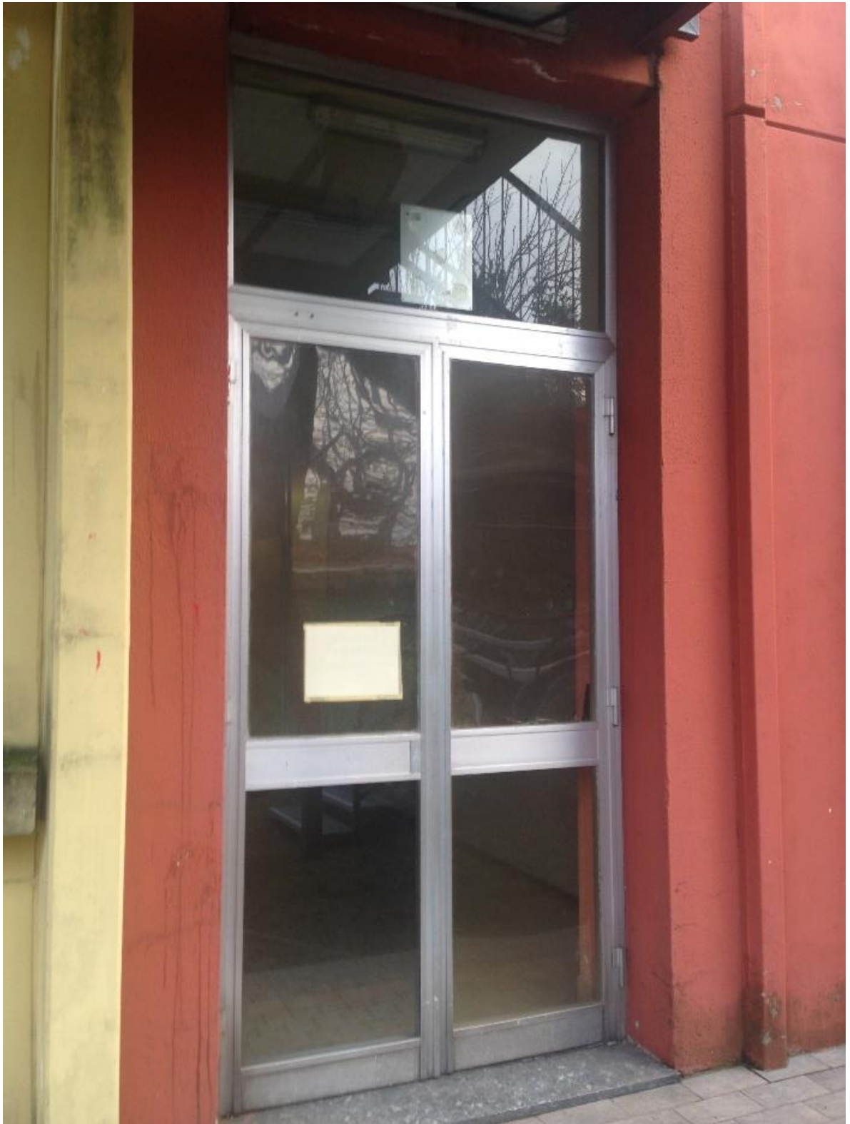
Figura 5. Uscita di emergenza esistente con maniglioni antipanico, presente al piano terra in prossimità delle scale antincendio_lato Nord-Ovest