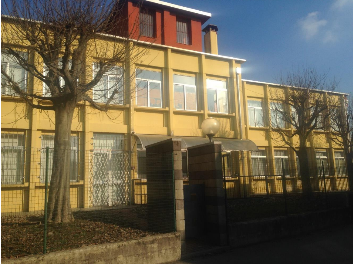
Figura 9. vista dei serramenti sul lato sud-ovest.