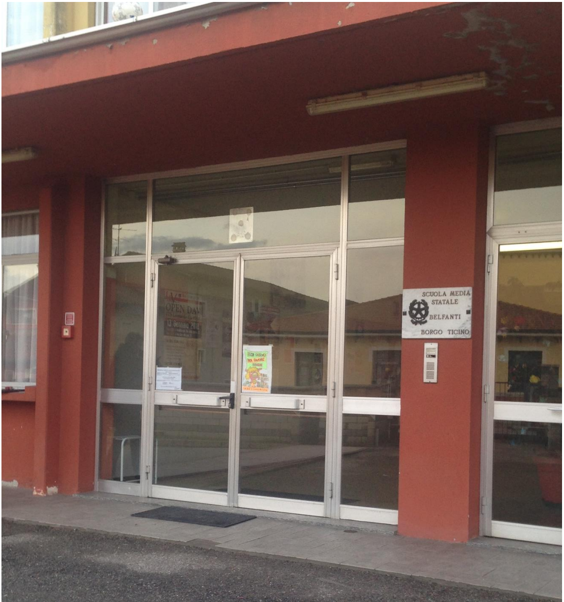
Figura 6. Porta d'ingresso esistente con maniglioni antipanico