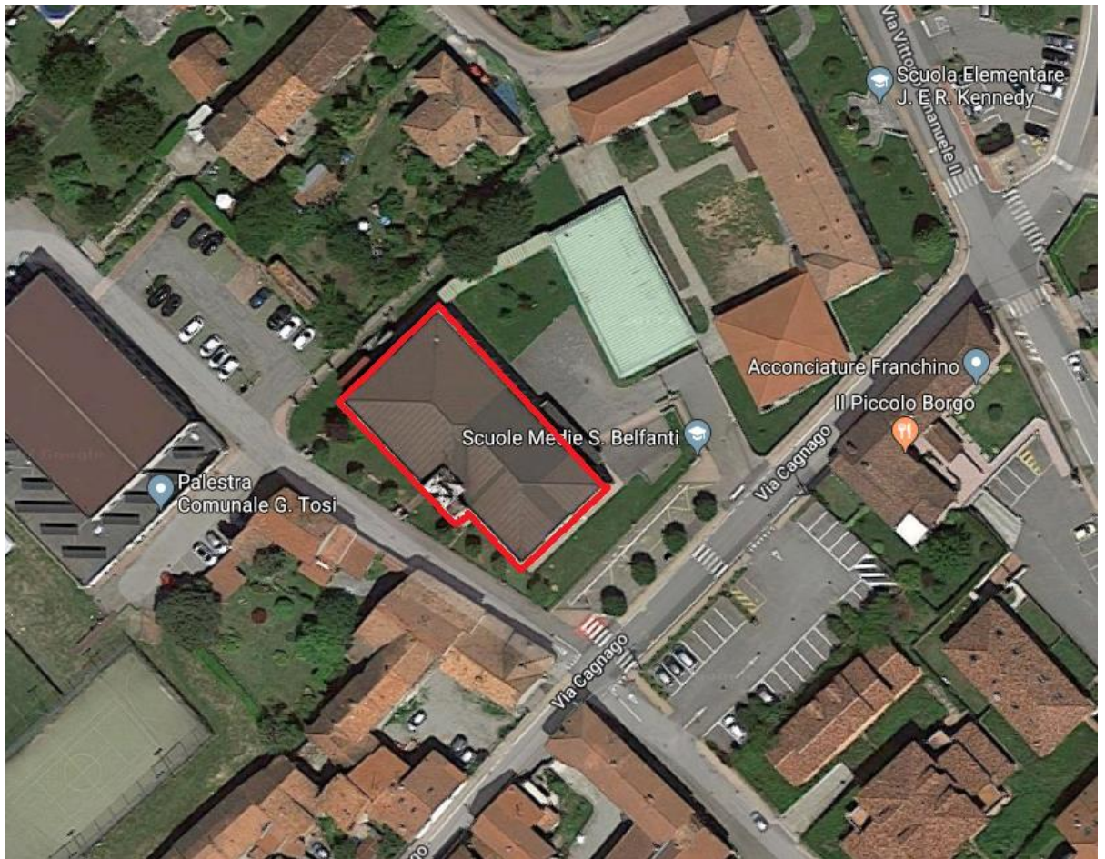
Figura 1. ubicazione edificio scolastico oggetto d'intervento_Via Cagnago, n.2