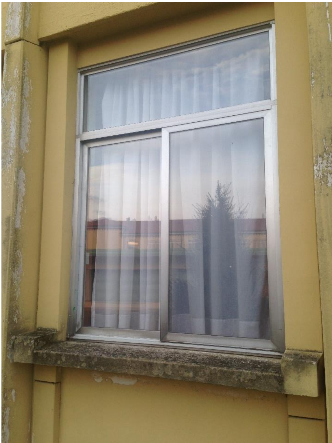
Figura 3. infissi esistenti con sopra luce ed apertura scorrevole che verranno sostituiti con finestre a doppia anta scorrevole senza sopra luce