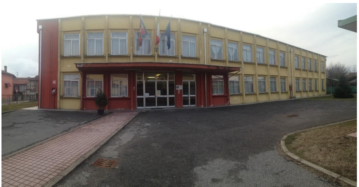
Figura 2. vista fronte principale_ esposizione a Nord- Est