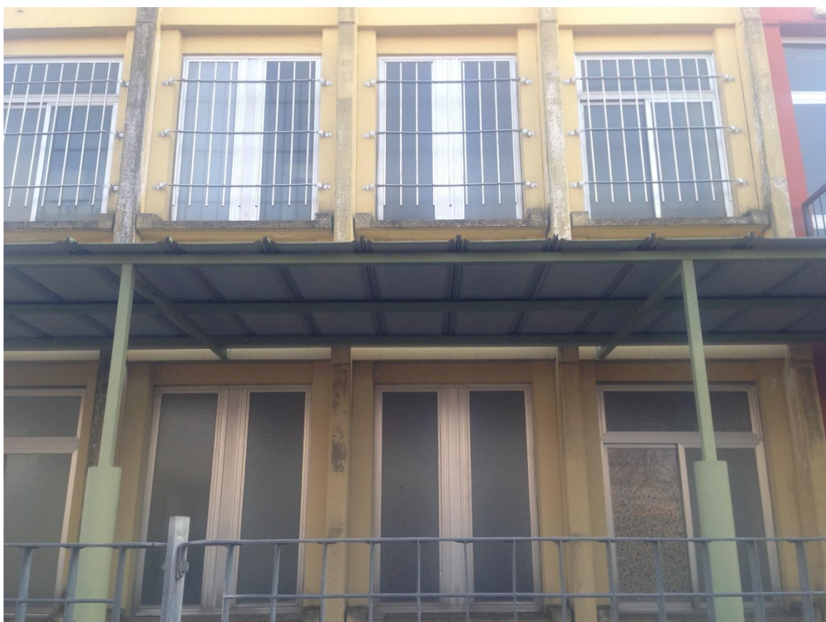
Figura 7. vista dei serramenti sul lato nord-ovest