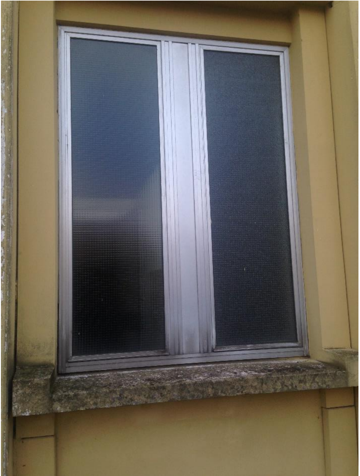
Figura 4. Serramento a doppia battuta con fisso centrale presente nei locali dedicati ai servizi igienici