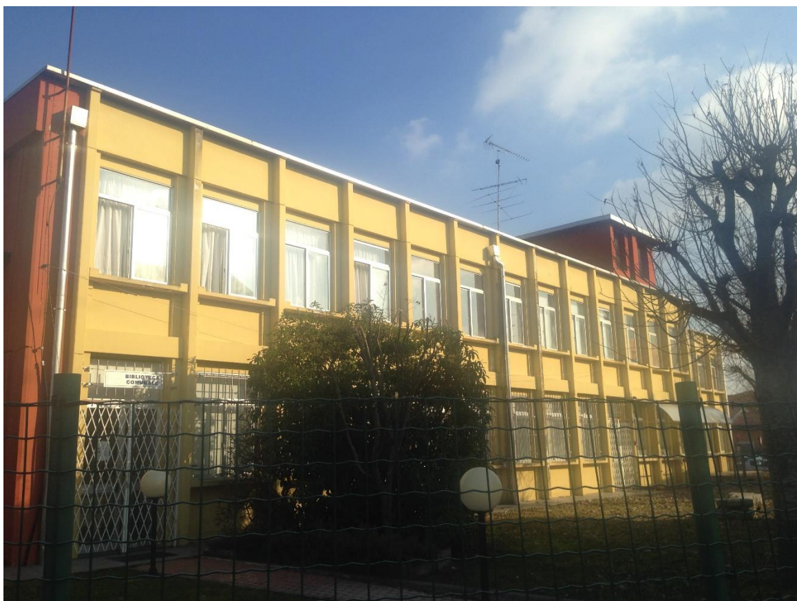
Figura 8. vista dei serramenti sul lato sud-ovest