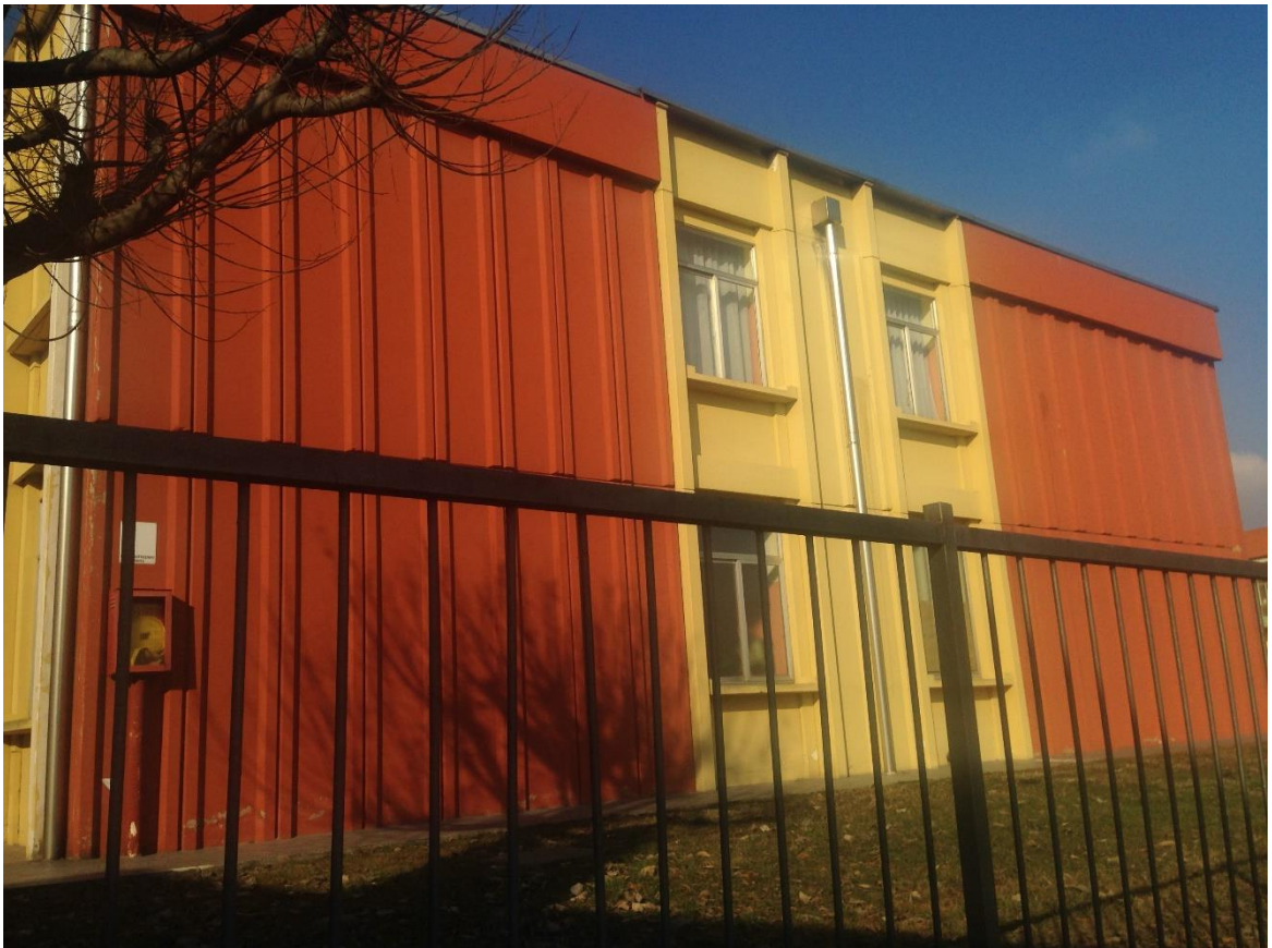
Figura 10. vista dei serramenti sul lato sud-est.